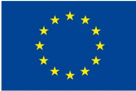
Europeiska jordbruksfonden för landsbygdsutveckling: Europa investerar i landsbygdsområden