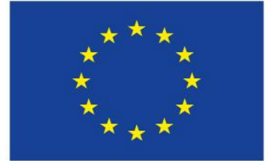
EUROPEISKA UNIONEN Europeiska struktur- och investeringsfonderna

Arbetet fokuserar på att hitta synergier mellan fonderna. Det uppnås genom att myndigheterna har kunskap om respektive fonds verksamhetsområde och vad som kan identifieras som gemensamma frågor. ”